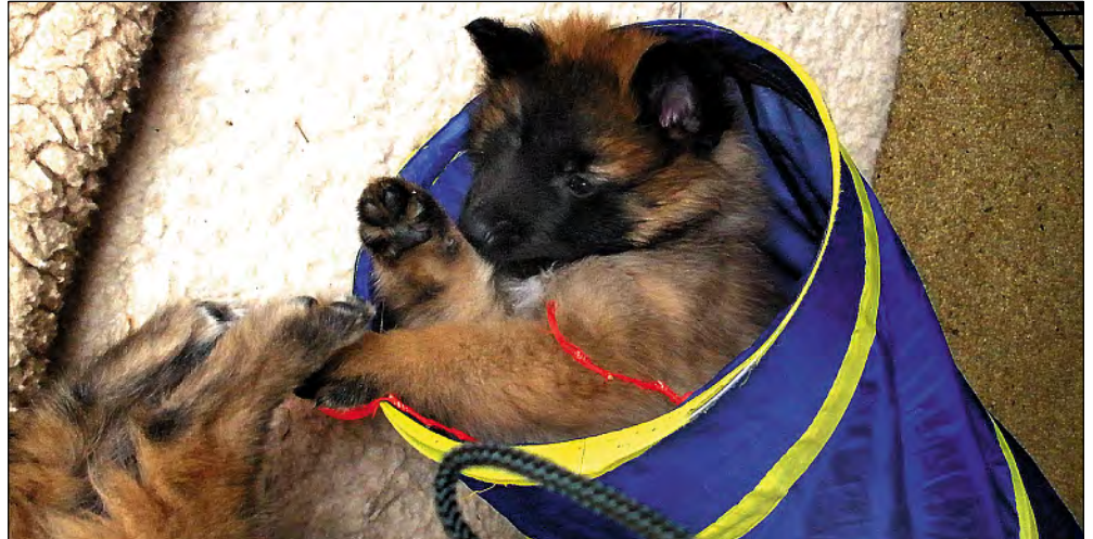
Individuelle Schlafplätze sollten für die Hunde bereit stehen.

Eine Hundepension oder ein Job als Hundesitter muss als Gewerbe angemeldet werden. Außerdem wird eine Erlaubnis nach §11 Tierschutzgesetz benötigt, um eine Hundepension zu eröffnen. Egal wie viele und welche Hunde aufgenommen werden. Ebenso